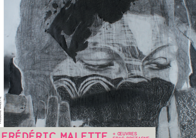
FRÉDÉRIC MALETTE + ŒUVRES FRAC BRETAGNE Il brûle comme le cœur