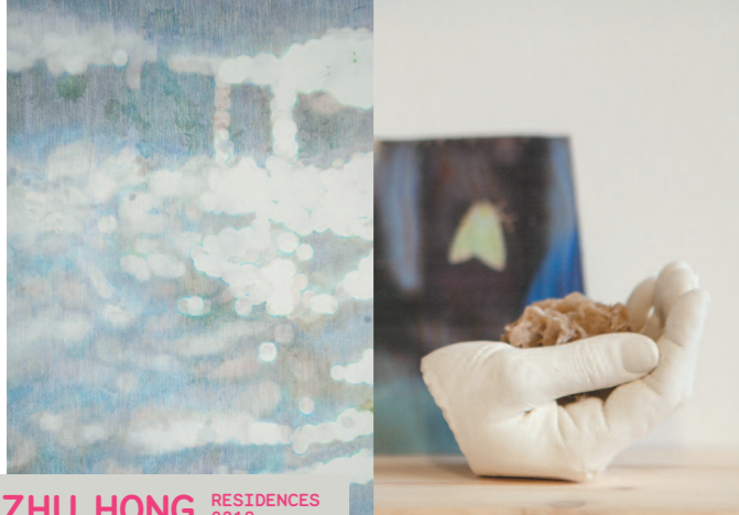
ZHU HONG RESIDENCES 2019 RIKA TANAKA