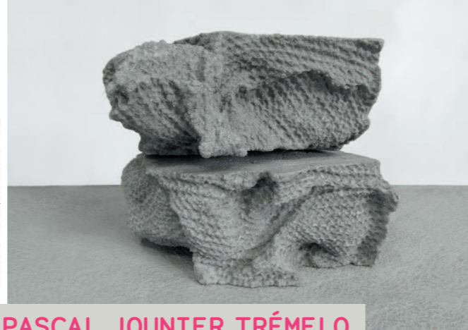
PASCAL JOUNIER TRÉMELO Les vacuoles de Vitruve